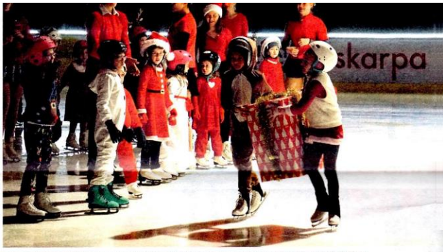
MYSTISKT PAKET I MITTEN. Det var säkerligen flera i publiken som kände av julstämningen när åkarna ställde ett stort julpaket mitt på isen.